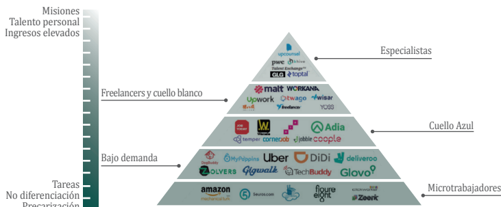
FIGURA 1. TIPOS DE PERSONAS TRABAJADORAS DE PLATAFORMA SEGÚN EL NIVEL DE ESPECIALIZACIÓN Y DE INGRESOS MONETARIOS