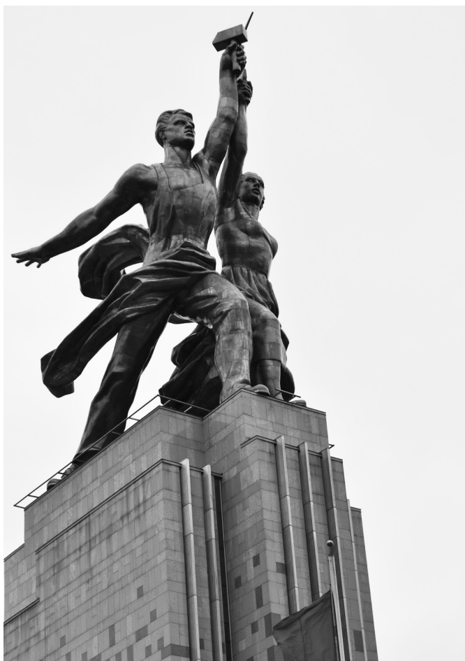
“Obrero y koljosiana”. Estatua de 24.5 metros de altura, hecha con acero inoxidable por la escultora soviética Vera Mújina en 1937. La palabra koljosiana viene de “koljós”, campos de cultivo colectivos instaurados por el régimen comunista, y símbolos de la introducción de la revolución en el campo.