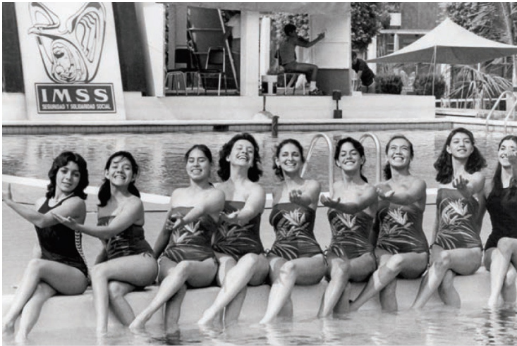
Equipo de natación del IMSS. Sin mayor información en original. IMSS, Historia ilustrada del deporte en el IMSS , Biblioteca Mexicana del Conocimiento, Ciudad de México, 2015.

Retomando el concepto del Deportivo Plan Sexenal —concentraciones urbanísticas con acceso a centros de salud y actividad físicas— a principios de los años sesenta y a iniciativa del director Benito Coquet, se incrementó el presupuesto dedicado a la infraestructura deportiva. Paralelamente, se inauguraron la Unidad Cuauhtémoc, la Unidad Independencia y la Unidad Morelos, las cuales contaban con albercas y gimnasios de primera calidad para los derechohabientes, envidia de clubes privados como el Deportivo Chapultepec o la YMCA. Allí, comenzaron a formarse atletas, equipos y selecciones propias del IMSS, que empezaron a competir en los distintos eventos organizados en la capital y que posteriormente destacarían a nivel in-